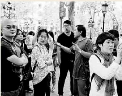
Un grupo de turistas asiáticos en el Passeig de Gràcia.